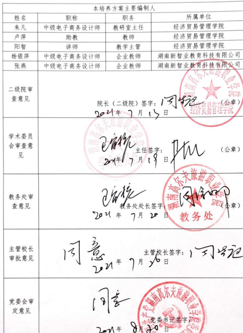
2021级电子商务专业人才培养方案审批表

（说明：本专业人才培养方案适用于三年全日制高职专业，由电子商务专业教研室制定，经专业建设指导委员会论证，学院党委会批准在2021级电子商务专业实施，本审批表随人才培养方案一起装订）。