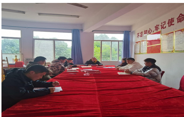
毕业设计标准研讨会议

2. 2023年12月20—12月22日，专业带头人根据省厅文件要求、学校毕业设计工作实施方案等要求，修订毕业设计标准。